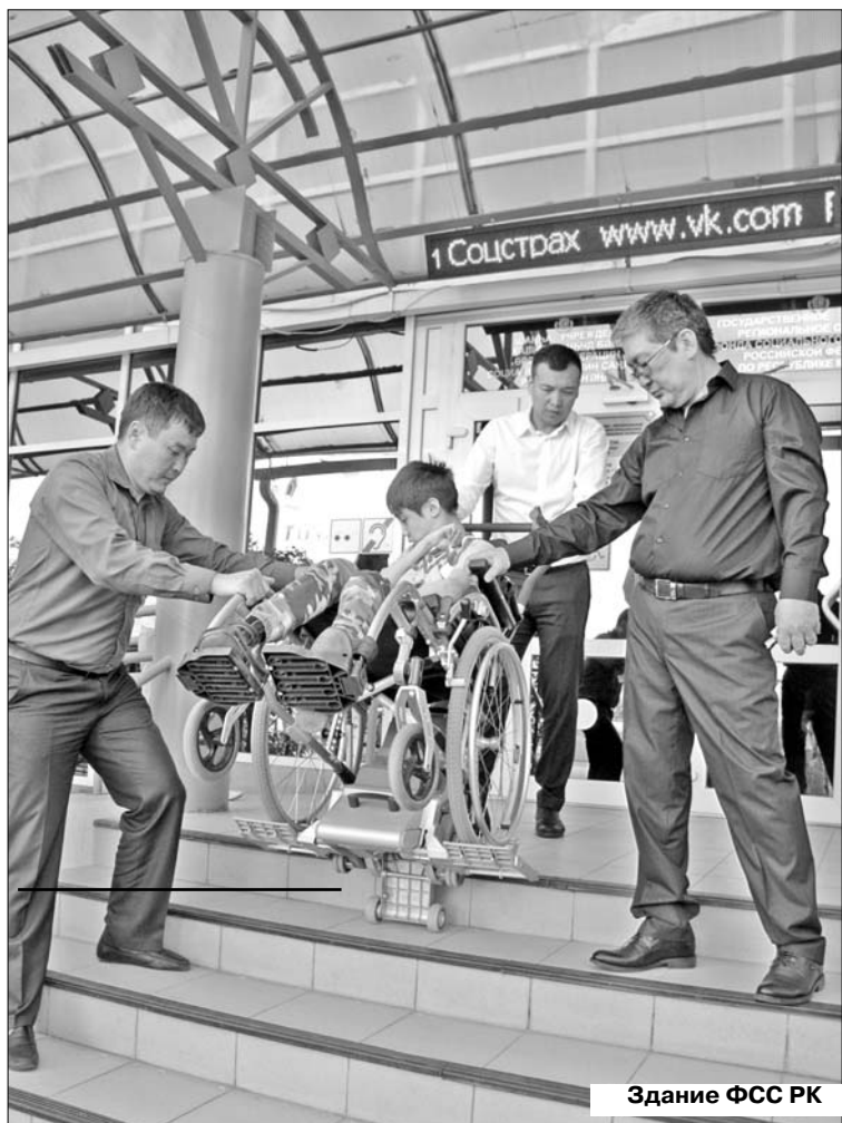
Здание ФСС РК

Вчера в столичной администрации были подведены итоги реализации программы "Доступная среда" в Республике Калмыкия в 2016 году.