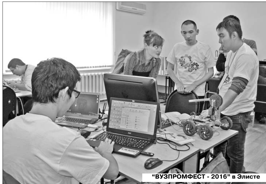
"ВУЗПРОМФЕСТ - 2016" в Элисте

К слову, в центре интеллектуальной собственности и трансфера тех-