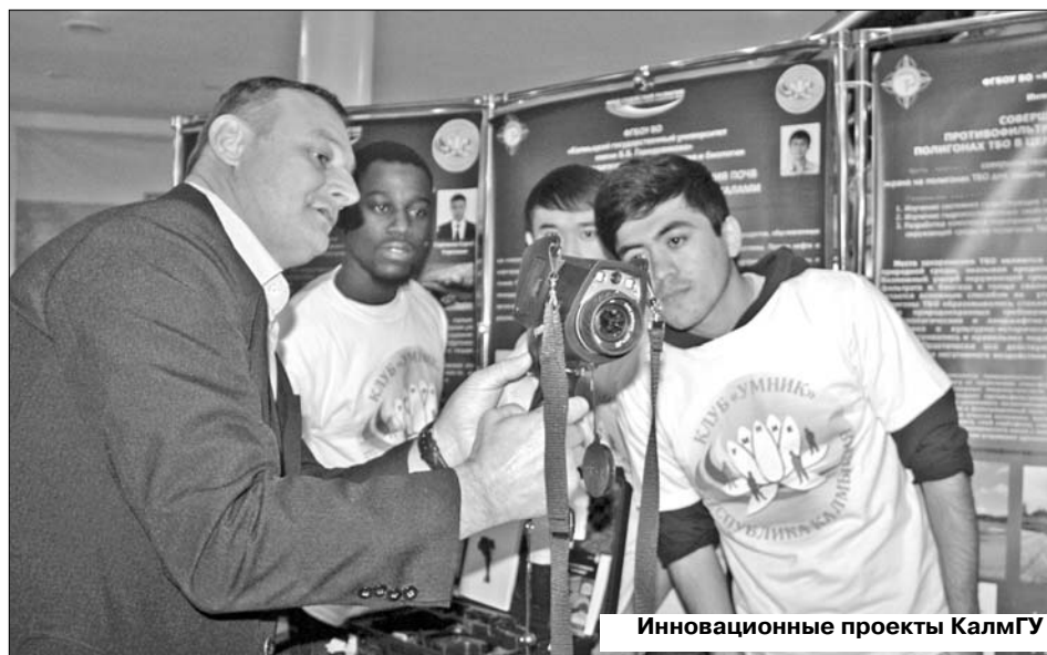
Инновационные проекты КалмГУ

уточнить, что в текущем году в результате серьезных изменений в системе распределения квот на обучение, выделяемых правительством РФ, иностранные абитуриенты получили право самостоятельно выбрать российские вузы, а это свидетельствует о том, что вузы производят набор в условиях жесткой конкуренции. Выбор вуза осуществляется через единую информационную систему. Реализация данной линии набора