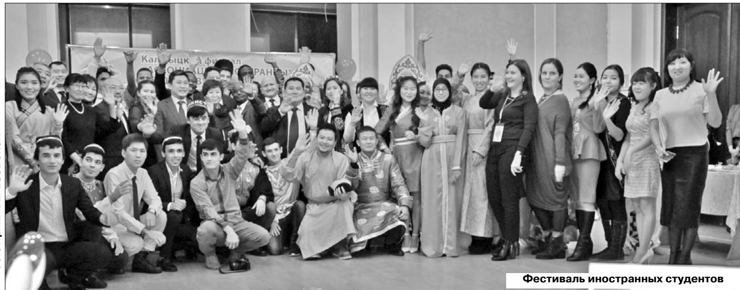
Фестиваль иностранных студентов